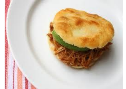
filled arepa with pork and avocado

An arepa is a flat, round bread made of cornmeal. It can be grilled, baked, boiled or fried. They are popular in Colombia and Venezuela and are similar in shape to the Mexican gordita and the Salvadorian pupusa. They are often eaten with a filling ( arepa rellena ) or a topping, such as beef, cheese, pork, beans and/or avocado. source:Wikipedia