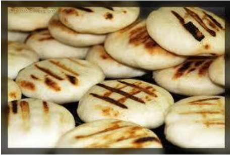
fresh grilled arepas

An arepa is a flat, round bread made of cornmeal. It can be grilled, baked, boiled or fried. They are popular in Colombia and Venezuela and are similar in shape to the Mexican gordita and the Salvadorian pupusa. They are often eaten with a filling ( arepa rellena ) or a topping, such as beef, cheese, pork, beans and/or avocado. source:Wikipedia